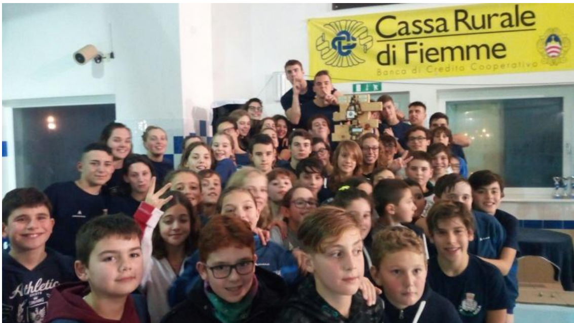
Società GP Nuoto Mira sul podio con il Trofeo

La ASD DOLOMITICA NUOTO CTT ringrazia tutto il suo staff di volontari per il successo della manifestazione e l'ottimo pasta party disponibile per tutti i partecipanti.