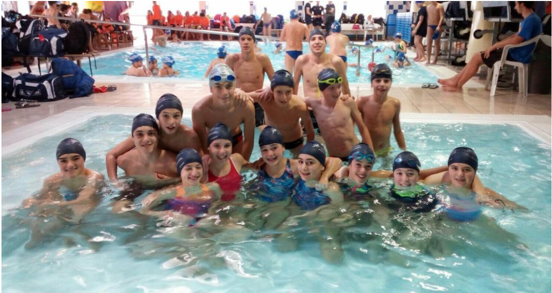
Parte della nostra squadra