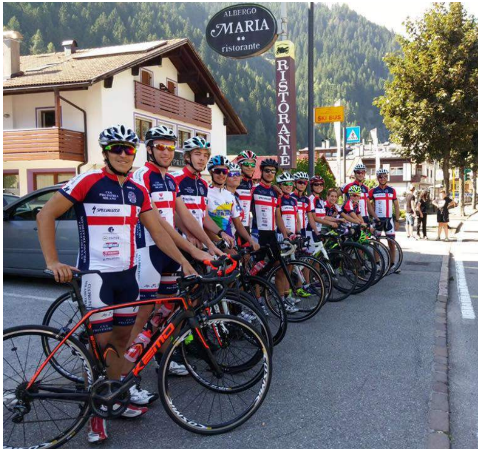
Cus Pro Patria