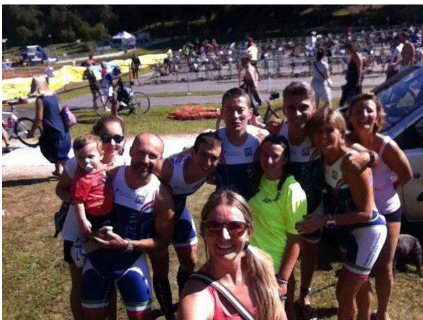
DoloTeam & Family