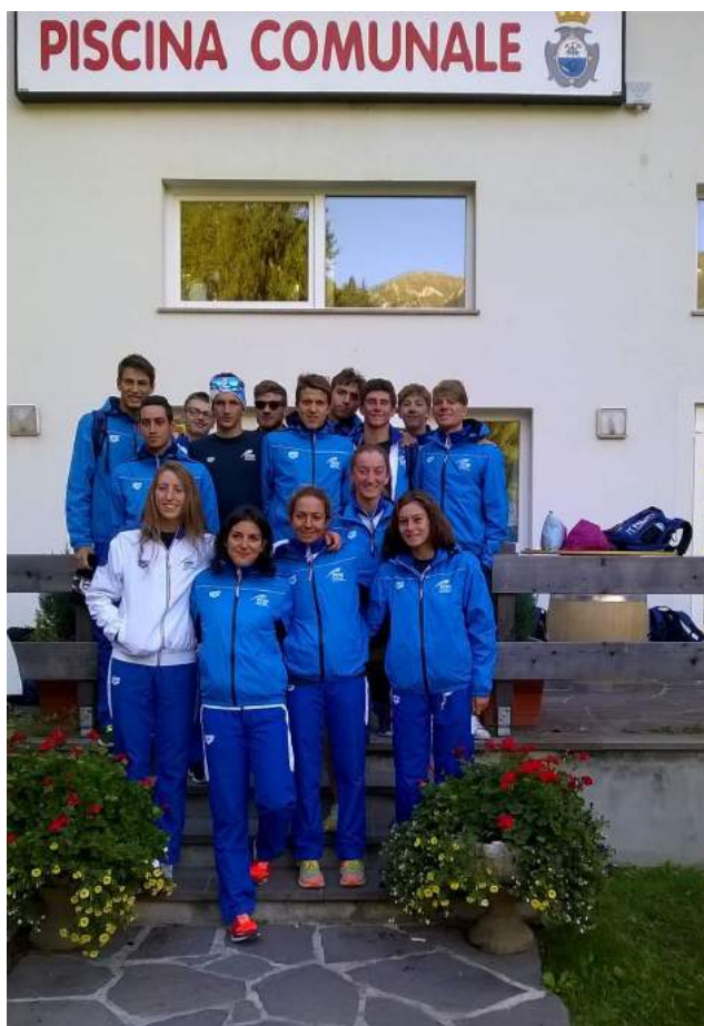
Nazionale Italiana Youth e Junior