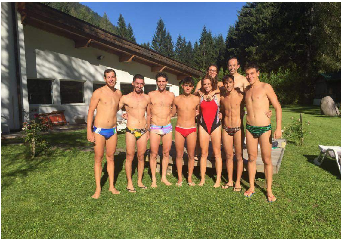
Otrè Triathlon Team