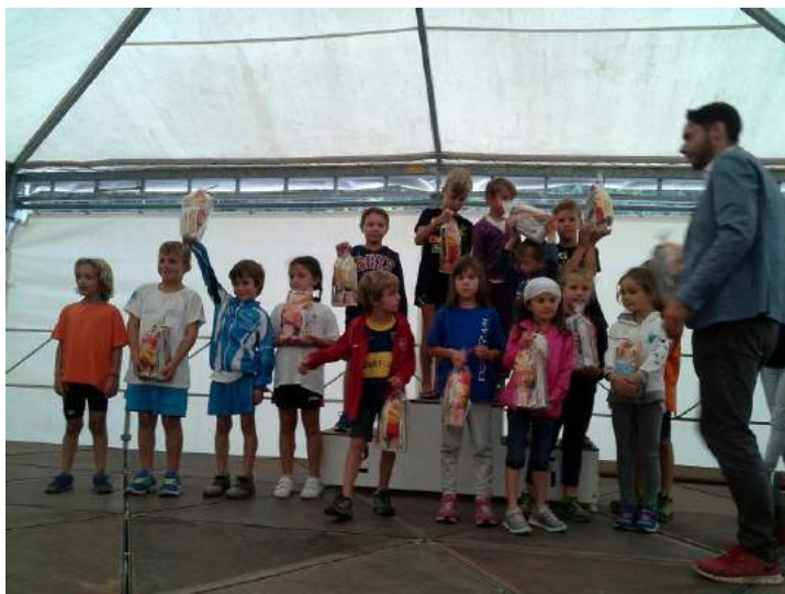
Premiazione Minicuccioli domenica