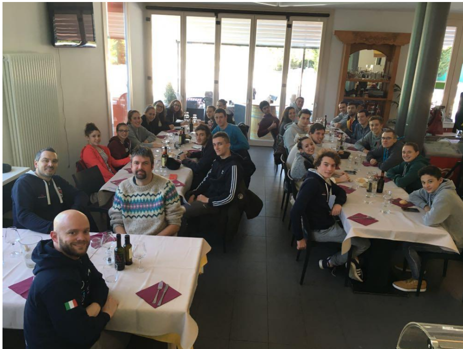
A pranzo assieme agli amici della Buonconsiglio Nuoto

Resoconto per la ASD DOLOMITICA NUOTO CTT a cura di Glauco Veronesi