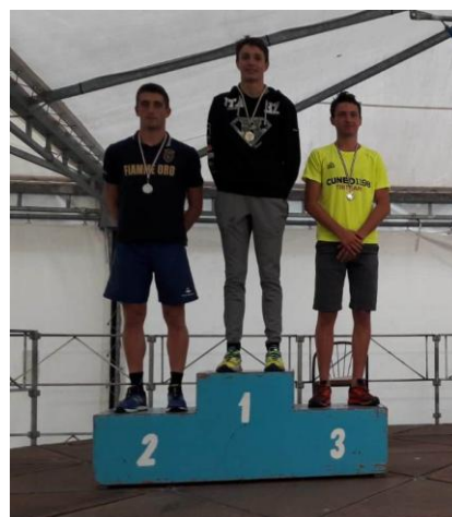
I podi assoluti femminile e maschile