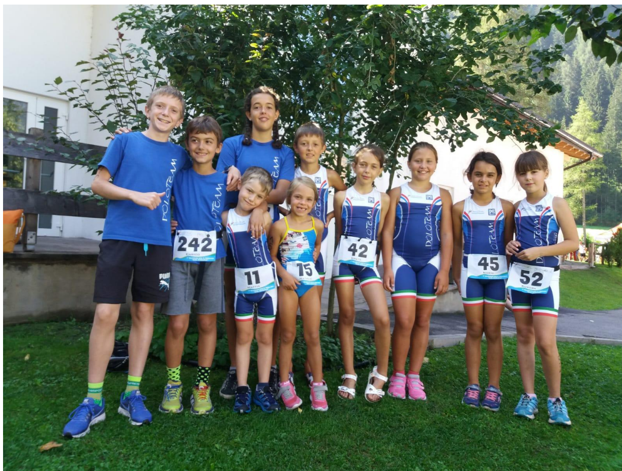
I nostri Giovanissimi

La nostra società ringrazia il Comune di Predazzo e tutti i suoi numerosi volontari per il successo della manifestazione, per gli apprezzati percorsi, per l'ottimo ed abbondante pasta party del sabato e della domenica.