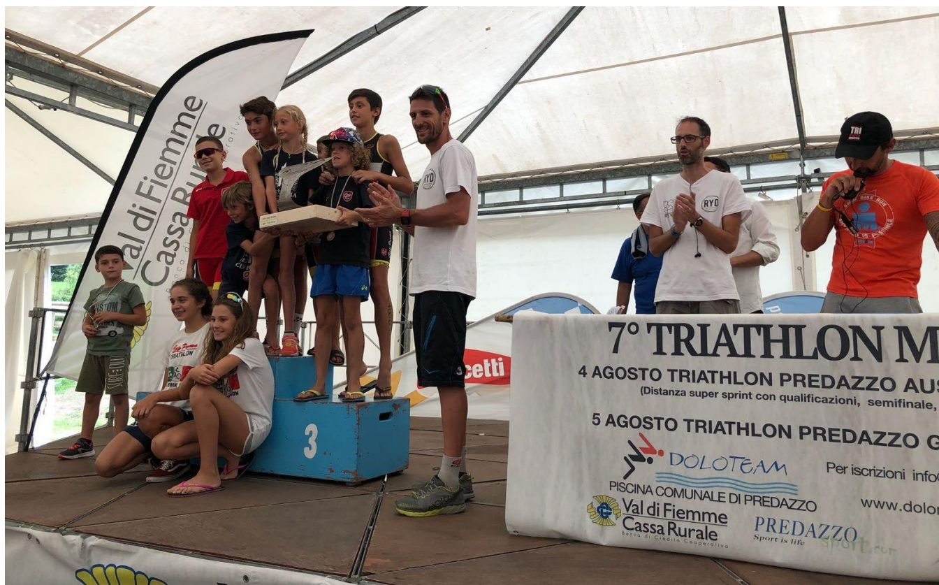
CUS PARMA vincitrice del Trofeo Triathlon Predazzo

Il Trofeo Triathlon di Predazzo, assegnato alla miglior società extraregionale, è rimasto in possesso della vincente 2017 ovvero Cus Parma che si è aggiudicato la classifica a punti anche in questa edizione 2018.