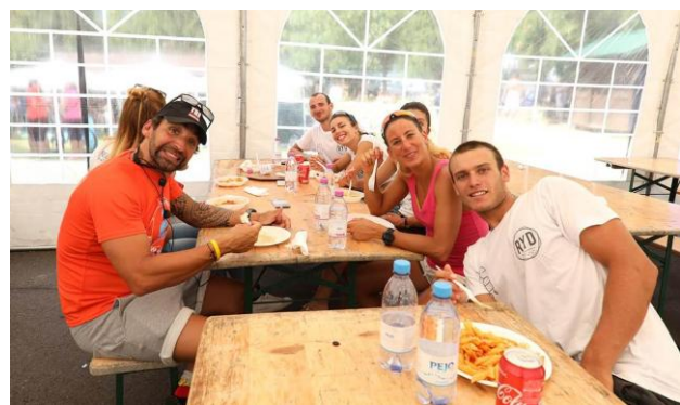
Una rappresentanza dei nostri mitici volontari

Soddisfatti della riuscita della manifestazione lo staff della Dolomitica Nuoto CTT con i suoi volontari ed anche l'Assessore al Comune di Predazzo, che ha ricordato come lo sport in Val di Fiemme sia una delle grandi risorse di questo territorio, e ha invitato tutti a vivere la bellezza di questi luoghi anche in inverno. E non poteva essere scritta la parola fine, senza aver indovinato il peso esatto di una intera forma di Gradevole di Predazzo, formaggio artigianale espressione di un territorio ricco di storia e di cultura gastronomica. Anche in questo caso, protagonisti due giovanissimi atleti, che si sono aggiudicati ex aequo il gustosissimo premio! E come sempre... l'ultimo chiude la porta. Grazie a tutti!